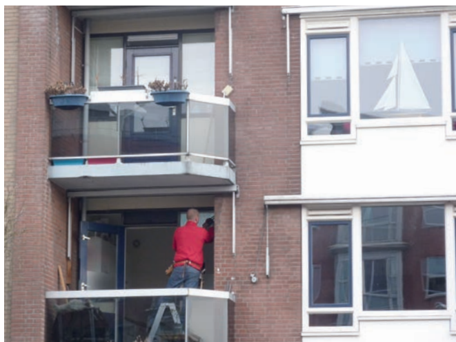
Glashandel de Baronie verving alle glazen balkonbalustrades door grijs, gelaagd glas.