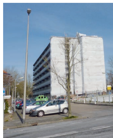
Glashandel Nicolai vervangt 2.000 m 2 vlakglas van verzorgingshuis Abbingahiem.

Glashandel Nicolai in Dokkum levert en monteert een grote diversiteit aan glasproducten. Het assortiment gaat van een glazen koelkastplankje tot hoogrendementsglas, brandwerende beglazing, figuurglas, enzovoort. Vanuit de werkplaats, waar Nicolai beschikt over een groot assortiment glas op voorraad, kan het bedrijf snel voldoen aan de eisen van de klanten.