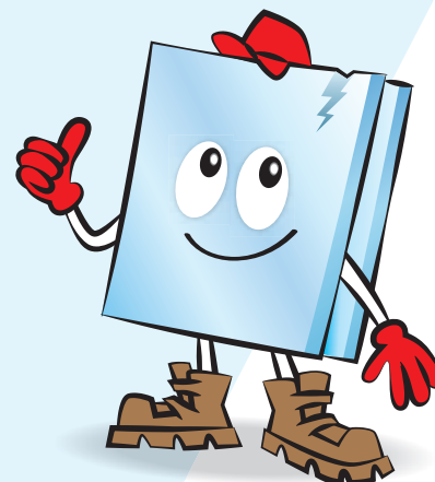
Mister Vlakglas, onze mascotte.

In elke nieuwsbrief besteden wij aandacht aan nieuws van onze relaties, zoals bedrijven, inzamelpunten en milieuparken. Onze nieuwsbrief verschijnt regelmatig en biedt u een uitgelezen kans om uw vlakglasnieuws onder de aandacht te brengen van iedereen die geïnteresseerd is in vlakglasrecycling, of daar professioneel bij betrokken is. Heeft uw bedrijf als relatie van Vlakglas Recycling Nederland ook iets speciaals te melden? Bel dan met Trudy Tuinenburg op 088 - 567 8802. . . .