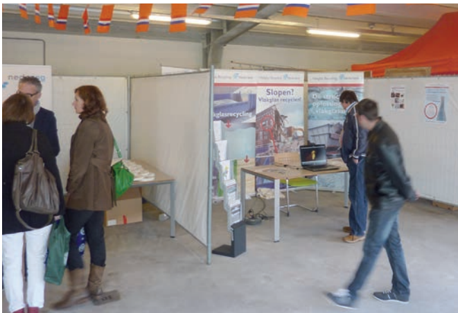
Op de Afvalinformatiemarkt stond ook een informatiestand van Vlakglas Recycling Nederland.

De gemeente Utrechtse Heuvelrug wil het afvalbeleid vernieuwen. Om te komen tot een beleid waar breed draagvlak voor is, wil de gemeente inwoners en belanghebbende partijen goed informeren en zo veel mogelijk laten meepraten. Vandaar de Afvalinformatiemarkt voor inwoners van de gemeente, die plaatsvond op de gemeentewerf in Doorn.